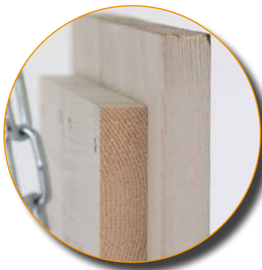
Foto op hout is in nog meer maten verkrijgbaar vraag er naar in onze winkel.

Je krijgt altijd van te voren een digitale proef van de foto op hout te zien, zodat je kan bekijken waar de naden lopen. Je hebt bij foto op hout de keuze tussen 1x en 2x white wash op het hout. Met 1x krijgt je een meer gevlamd hout effect in de foto als bij 2x white wash. Bij twijfel laat je adviseren door ons.